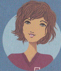
MISS DAISY asistenta directorului