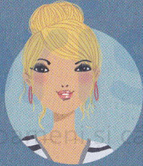
RUBY inamica Kinra Girls